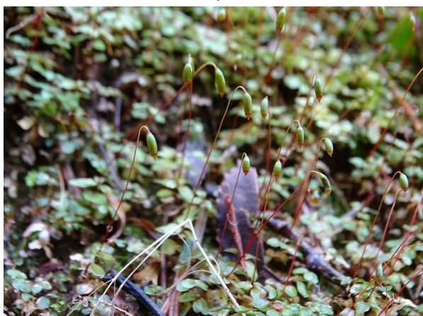
スジチョウチンゴケ